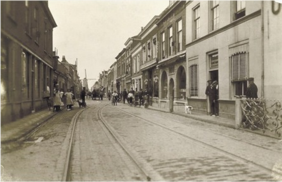
De Molendijk in Oud-Beijerland, 1898.