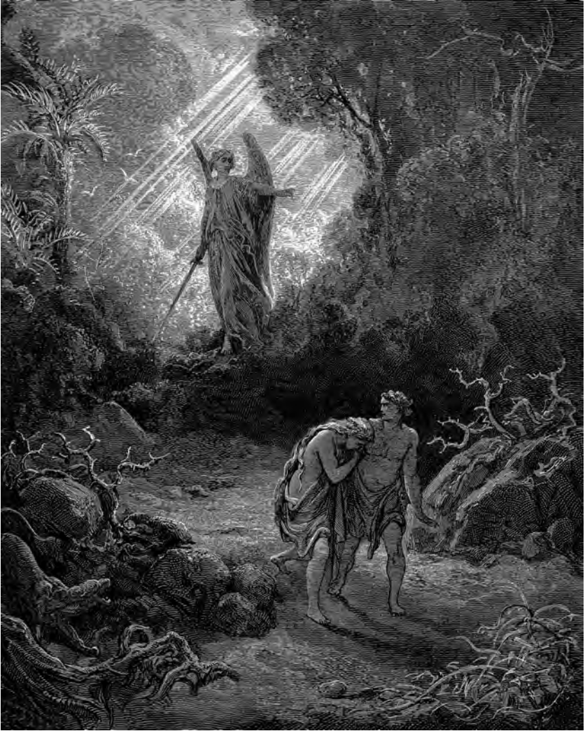
Adam en Eva worden verdreven uit het paradijs. (Gustave Doré)

in het Oude Testament klinkt op het verwerpen van Gods inzettingen en het tergen van God het dreigement van toring, koorts, pestilentie en vurige slangen (Lev. 26, Num. 14 en 21). In Deuteronomium 28 vinden we zelfs een hele vervloekingparagraaf. Als straf op ongehoorzaamheid hebben onder de vloeken ook ziekten een plaats gekregen, waaronder bovengenoemde ziekten en verder spenen, schurft, krauwsel, blindheid